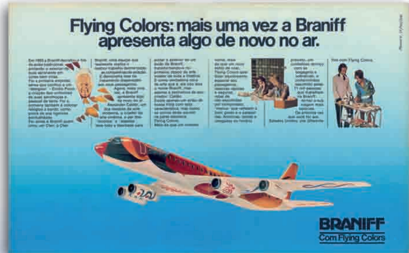
Visto aqui acionando motores em Viracopos, o DC-8 comprova que o resultado final ficou simplesmente espetacular. A aeronave foi batizada de "Flying Colors of South America".

escala 1:25, todas brancas, sobre as quais trabalhou por algumas semanas. O padrão escolhido foi apresentado pelo artista à administração da Braniff. A manutenção propôs algumas pequenas mudanças de ordem prática e o DC-8 finalmente começou a ser pintado. Calder pessoalmente dirigiu os trabalhos e pintou, ele próprio, os temas que ornamentaram as naves dos motores. No dia 2 de novembro de