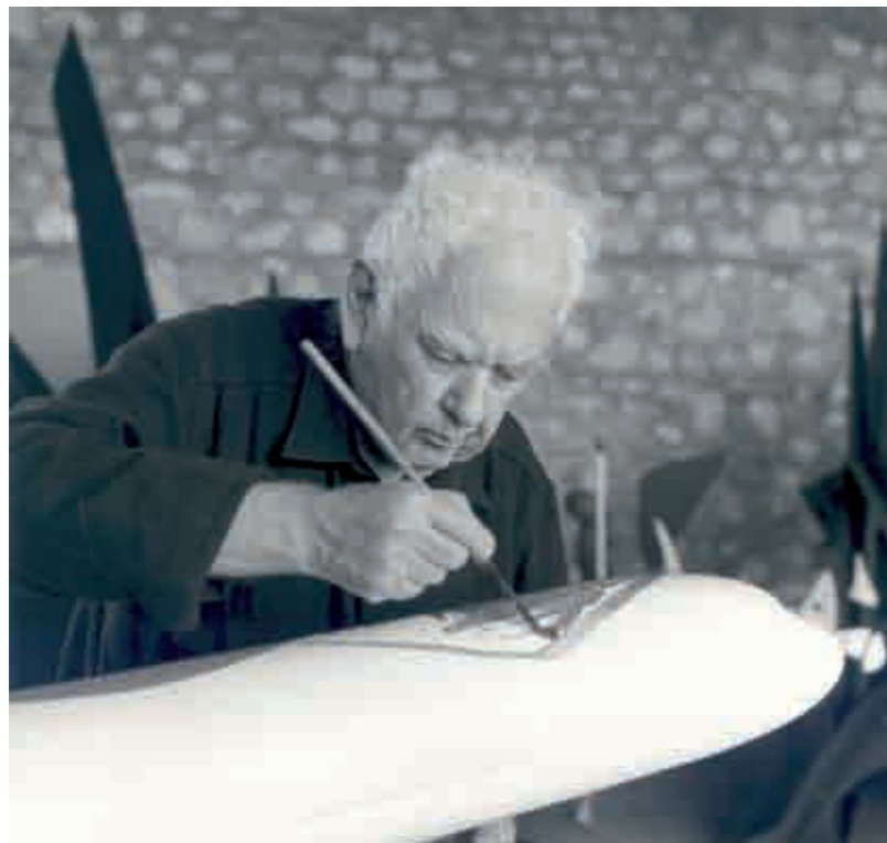
Arte voadora: o gênio Alexander Calder pinta, ele próprio, maquetes do DC-8. Vários estudos foram feitos até que o artista e a companhia se deram por satisfeitos.

nome tão longo quanto a duração dos serviços com múltiplas escalas) foi escolhido para promover as inovações trazidas pelo jato: "Mais veloz – acima de 1.000 quilômetros/hora", "Finas iguarias – o Gold Service da Braniff", "Luxo requintado – decoração exclusiva da Braniff" eram algumas das promessas dos novos serviços. Os novos jatos não podiam operar em Congonhas e a solução foi transferir os vôos para Viracopos. Passageiros embarcados em São Paulo podiam voar entre Congonhas e Viracopos a bordo dos Dart Herald da Sadia sem pagar a mais por isso.