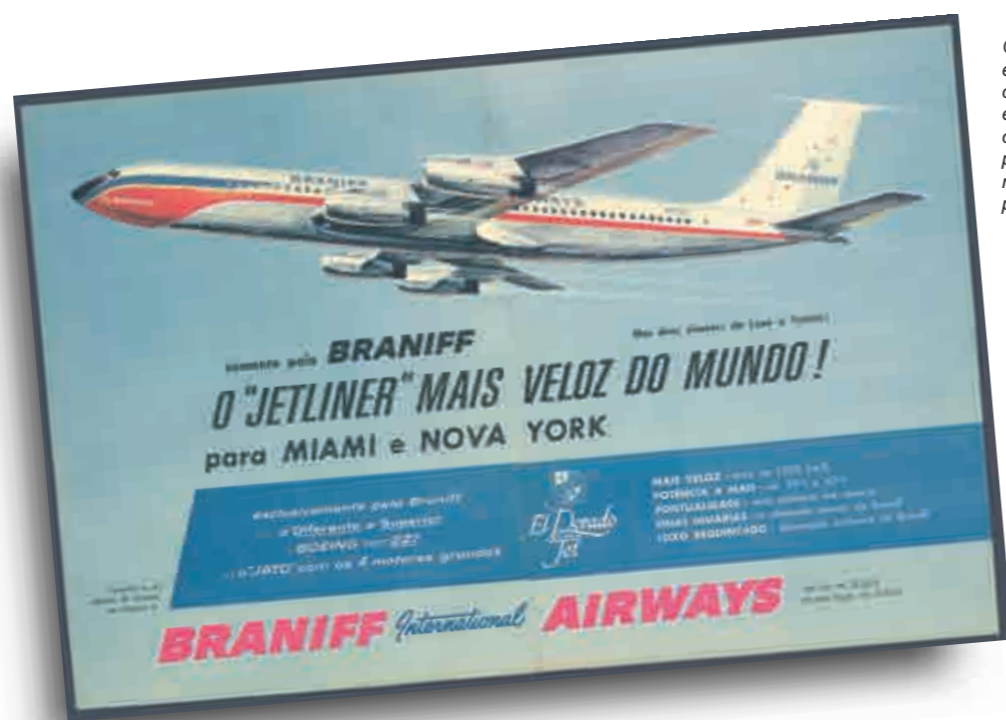
O El Dorado Jet é anunciado com orgulho pela empresa. Entre outras razões, pelos seus motores mais potentes.

luxo e turista. O detalhe é que nos aviões a pistão, a classe de luxo ficava na parte traseira da cabine, mais afastada do ruído e da vibração das hélices. As longas jornadas eram compensadas por um serviço esmerado, realmente personalizado. Cardápios elaborados, vinhos e champanhes finos eram itens que não faltavam a bordo.