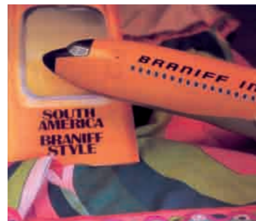
Cheia de bossa: ações promocionais inovadoras e cardápios esmerados são marcas registradas da empresa.