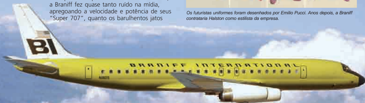
Cores novas no céu: a Braniff acaba com a era das pinturas sem graça e chama a atenção com seus jatos coloridos.

A empresa entrou na era do jato puro com a compra dos 707-227, modelos feitos sob medida para as operações latino-americanas em aeroportos quentes e altos. Mais potentes que os 707 então oferecidos, a Braniff fez quase tanto ruído na mídia, apregoando a velocidade e potência de seus "Super 707", quanto os barulhentos jatos