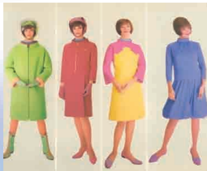
Os futuristas uniformes foram desenhados por Emilio Pucci. Anos depois, a Braniff contrataria Halston como estilista da empresa.

Mas para resolver a questão do ruído, o futuro já apontava para um novo meio de propulsão, que a Braniff abraçou entusiasmamente.