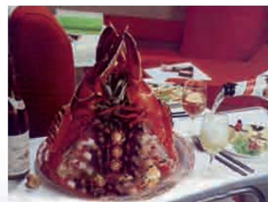
No detalhe acima, um dos pratos servidos na primeira classe da Braniff.

faziam nos aeroportos. O primeiro voo de um "Super 707" para o Brasil foi feito em 27 de abril de 1960, inicialmente para São Paulo (Viracopos) e depois estendido para o Rio de Janeiro (Galeão) em 2 de agosto. Operado uma vez por semana, o voo BN 972 partia do Rio todas as quintas-feiras às 9h30, chegava a Viracopos às 10h29, de onde partia às 11h15 com destino a Lima, chegava à capital peruana às 13h44 e, depois de pousar no Panamá às 17h35, tocava em solo ianque, mais precisamente em Miami, às 20h55, e em Nova York, à 0h55, já nas madrugadas das sextas-feiras. O voo BN 970 era operado com equipamento DC-7C e partia do Rio de Janeiro aos sábados, às 11h00, chegava a Viracopos às 12h15, a Lima às 18h35, Guayaquil às 22h15, Panamá à 1h30, Miami às 6h15, Washington às 10h49 e (ufa), finalmente, em Nova York às 12h27 dos domingos.