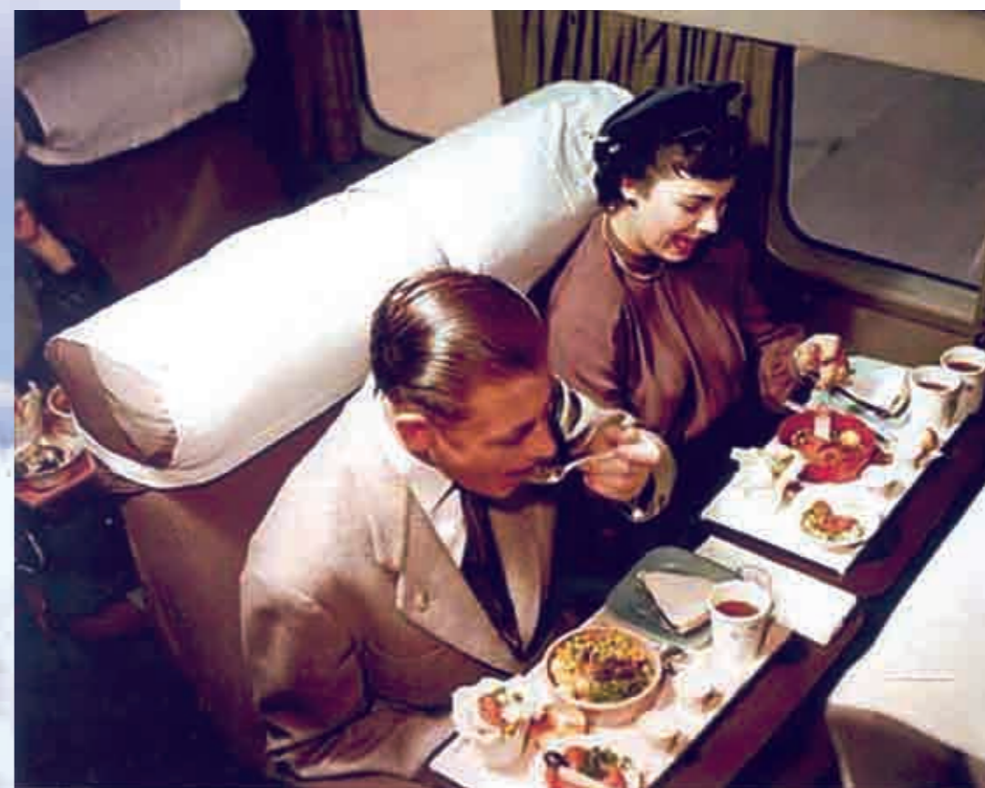
Desde os tempos do DC-6, a companhia esforçou-se em oferecer um serviço diferenciado.

Com a introdução do "Super 707", a Braniff inovou no serviço de bordo. O El Dorado Super Jet Golden Service (um