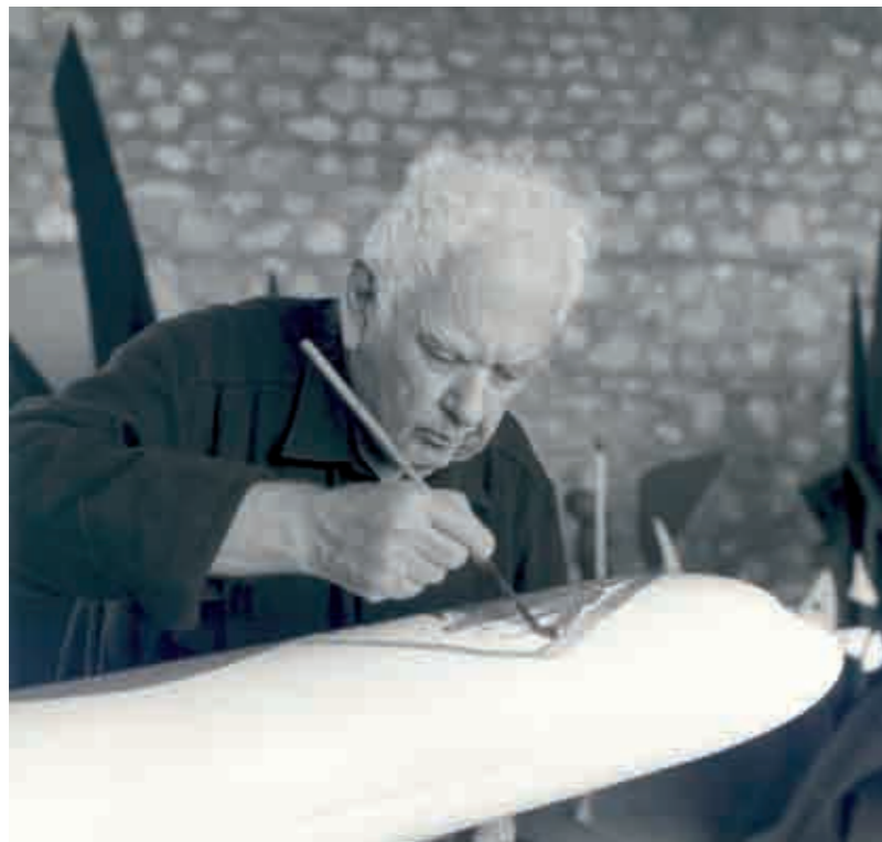
Arte voadora: o gênio Alexander Calder pinta, ele próprio, maquetes do DC-8. Vários estudos foram feitos até que o artista e a companhia se deram por satisfeitos.

nome tão longo quanto a duração dos serviços com múltiplas escalas) foi escolhido para promover as inovações trazidas pelo jato: "Mais veloz – acima de 1.000 quilômetros/hora", "Finas iguarias – o Gold Service da Braniff", "Luxo requintado – decoração exclusiva da Braniff" eram algumas das promessas dos novos serviços. Os novos jatos não podiam operar em Congonhas e a solução foi transferir os vôos para Viracopos. Passageiros embarcados em São Paulo podiam voar entre Congonhas e Viracopos a bordo dos Dart Herald da Sadia sem pagar a mais por isso.