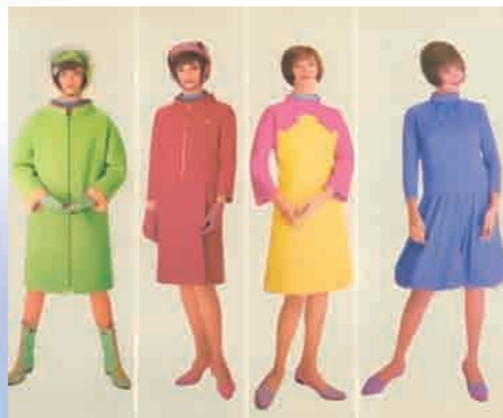
Os futuristas uniformes foram desenhados por Emilio Pucci. Anos depois, a Braniff contrataria Halston como estilista da empresa.

Mas para resolver a questão do ruído, o futuro já apontava para um novo meio de propulsão, que a Braniff abraçou entusiasmamente.